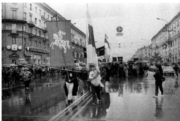
Шествие «Черновобильский марш» по Ленинскому проспекту г. Минска 30 сентября 1989 г.

Среди причин активного протеста можно назвать ухудшение здоровья детей 8 при ограниченных возможностях оздоровления; экономические проблемы, связанные с ухудшением продовольственного снабжения; страх перед местной сельскохозяйственной продукцией; бегство простых людей, экспертов из зараженных регионов и др. Данный комплекс проблем, имевших место уже в 1986–1988 гг., еще более обострился в 1989 г. в связи с опубликованием карты радиационно зараженных регионов, первыми частично свободными выборами, формированием публичного дискурса о последствиях черновобильской катастрофы, снятием грифа секретности с последствий катастрофы, многочисленными критическими статьями в средствах массовой информации. В 1989 г. черновобильские митинги и забастовки имели место в Наровле, Хойниках, Брагине и других районных центрах. 30 сентября 1989 г. в Минске прошел первый «Черновобильский марш», организованный БНФ.