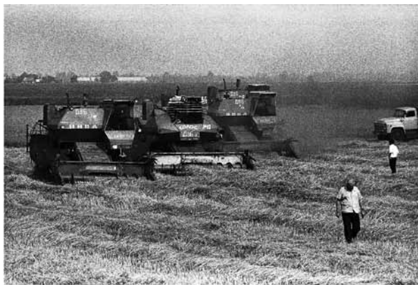
Уборка урожая на радиоактивно зараженной территории колхоза «Звезда» Ельского района Гомельской области в 1986 г.

Коллективная эвакуация, зачастую совместное размещение и проживание в различных санаториях и лагерях в ходе эвакуационных мероприятий способствовали быстрой самоорганизации данной группы с целью решения возникших проблем путем легального письменного протеста. Значительная часть обращений данного периода была составлена от имени матерей, родителей. Символическим средством коммуникации с властью в 1986 г. стали коллективные жалобы, затрагивающие правовые нарушения.