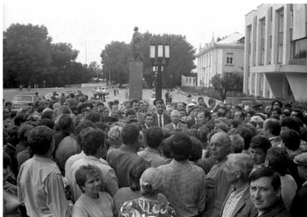
Член бюро ЦК КПСС Е. К. Лигачев во время посещения г. Брагина Гомельской области в 1988 г.

Составители обращений презентировали себя хорошо информированными о радиационном уровне. Не исключая возможностей информирования населения военными и медиками, все же следует рассматривать данную информацию как тактический прием составителей обращений с целью убедить адресатов в знании реальной ситуации и подтолкнуть их тем самым к решению поставленных вопросов. При этом зачастую составители обращений находились под влиянием различных слухов, вызванных недостатком информации в связи с официальной политикой замалчивания последствий чернобыльской катастрофы. Они выражали также недоверие средствам массовой информации ввиду искаженного освещения последствий катастрофы.